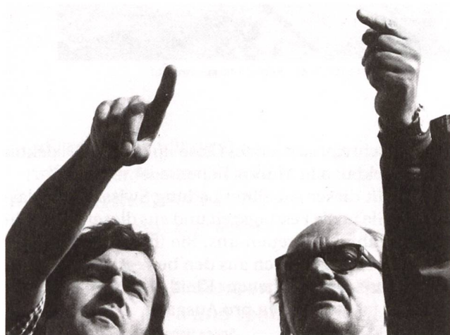
Dällebach Kari (1970) Regie: Kurt Früh