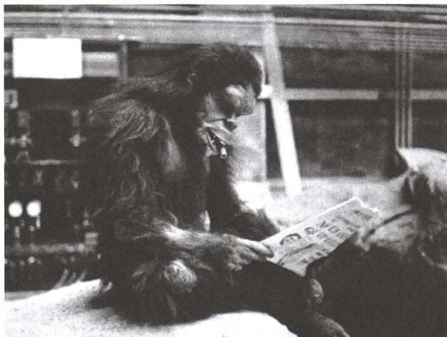
2001: A Space Odyssey (1968) Hinter den Kulissen