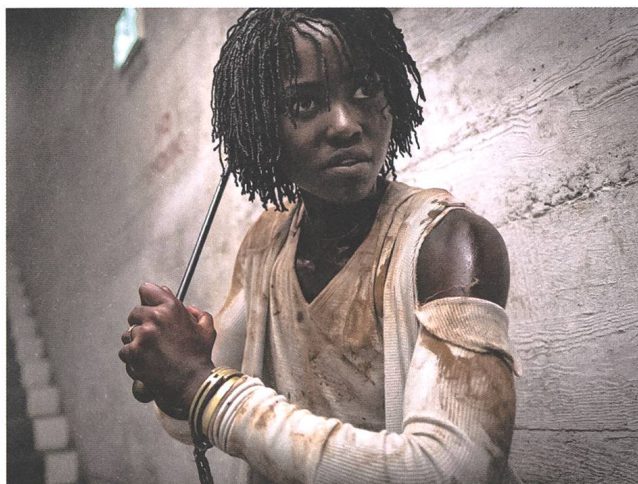
Us (2019) Regie: Jordan Peele