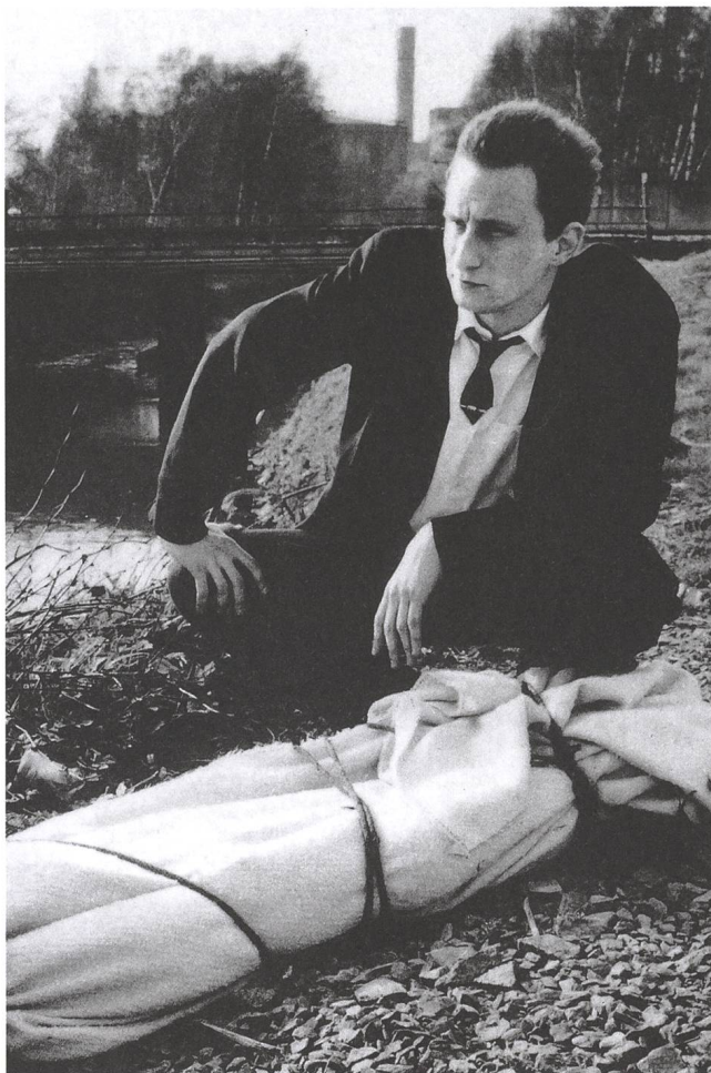
C'est arrivé près de chez vous (1992) mit Benoît Poelvoorde