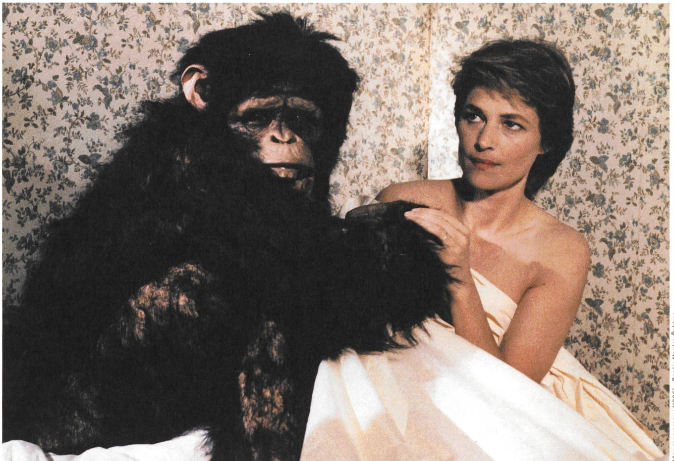
Max mon amour (1986) Regie: Nagisa Ōshima

Verlag Filmbulletin Dienerstrasse 16 CH-8004 Zürich +41 52 226 05 55 info@filmbulletin.ch www.filmbulletin.ch