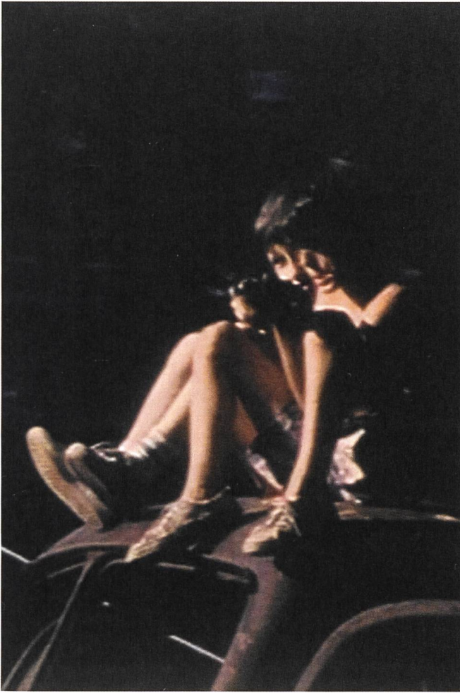
Ecce Homo: Behold the Man (1994) Regie: Vesna Ljubić