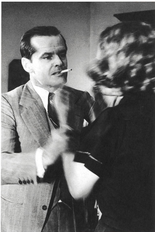
Chinatown (1974) Regie: Roman Polanski