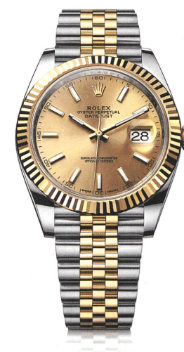
OYSTER PERPETUAL DATEJUST 41

EXKLUSIVER ZEITGEBER DER ACADEMY OF MOTION PICTURE ARTS AND SCIENCES