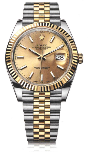
OYSTER PERPETUAL DATEJUST 41

EXKLUSIVER ZEITGEBER DER ACADEMY OF MOTION PICTURE ARTS AND SCIENCES