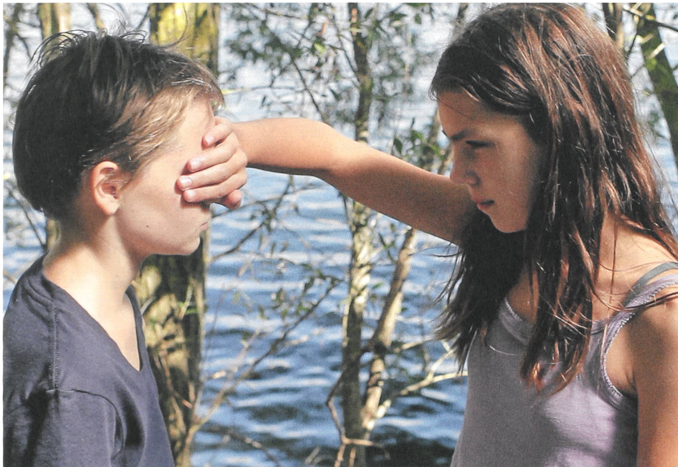
Tomboy (2011) Regie: Céline Sciamma