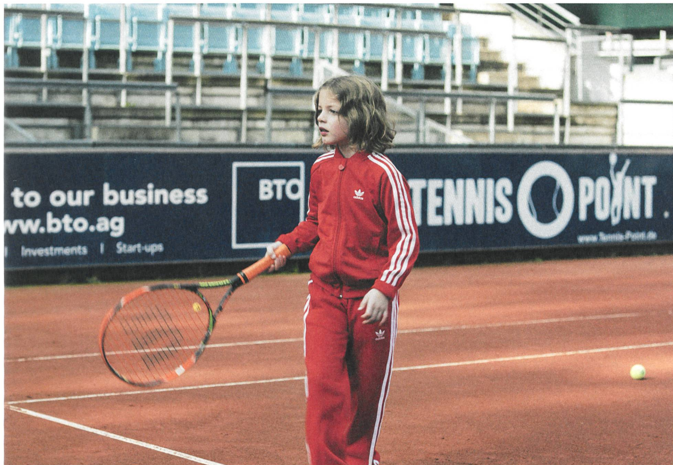
Ich war zuhause, aber... Regie: Angela Schanelec