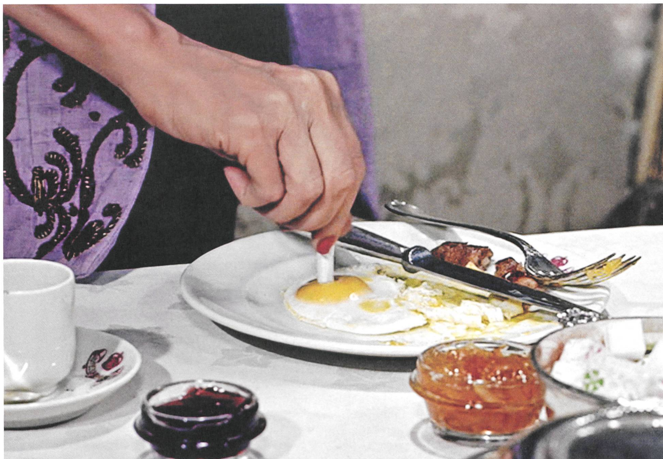
To Catch a Thief (1955) Regie: Alfred Hitchcock