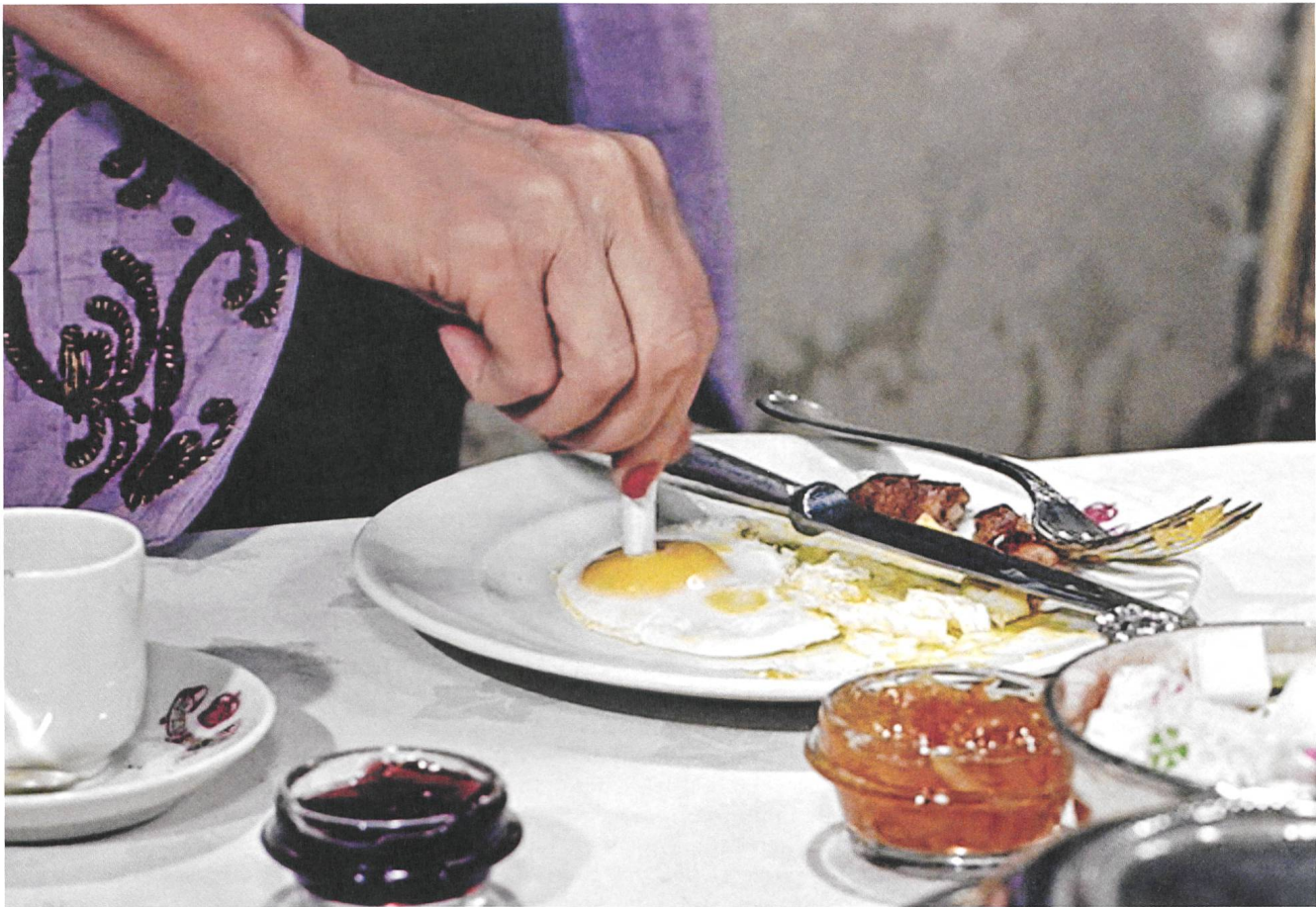
To Catch a Thief (1955) Regie: Alfred Hitchcock