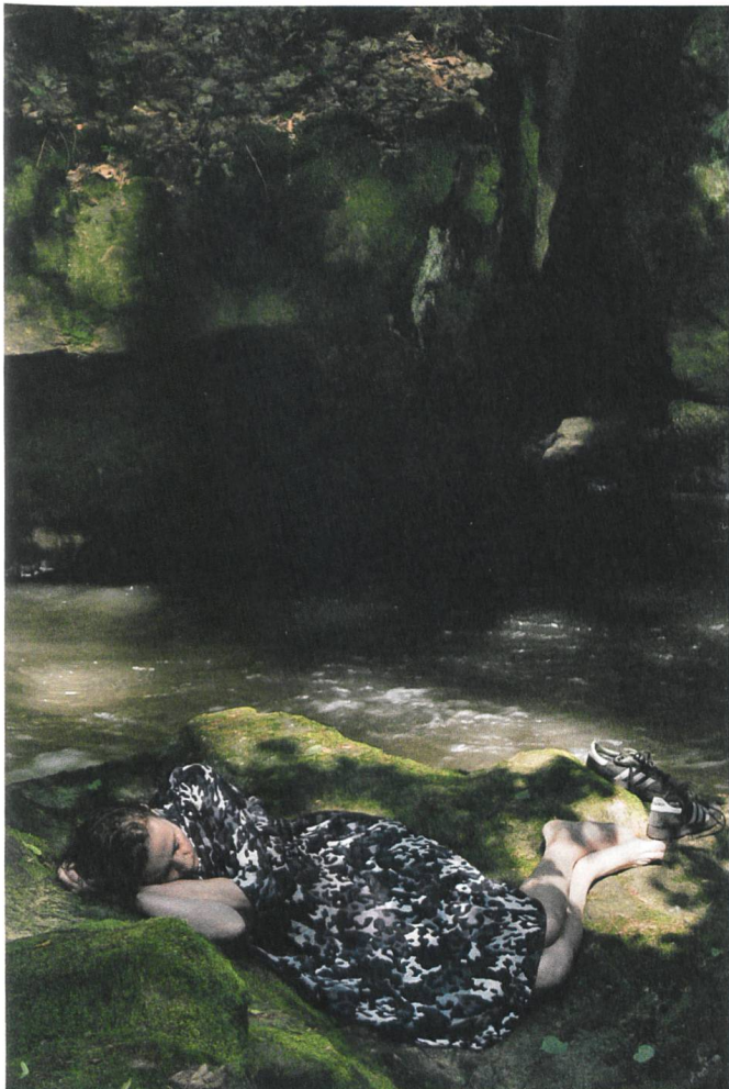
Ich war zu Hause, aber (2019) Regie: Angela Schanelec