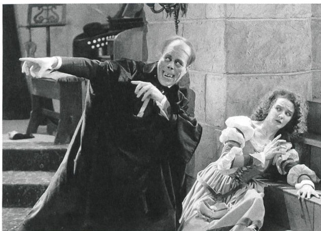
The Phantom of the Opera (1925) Regie: Rupert Julian