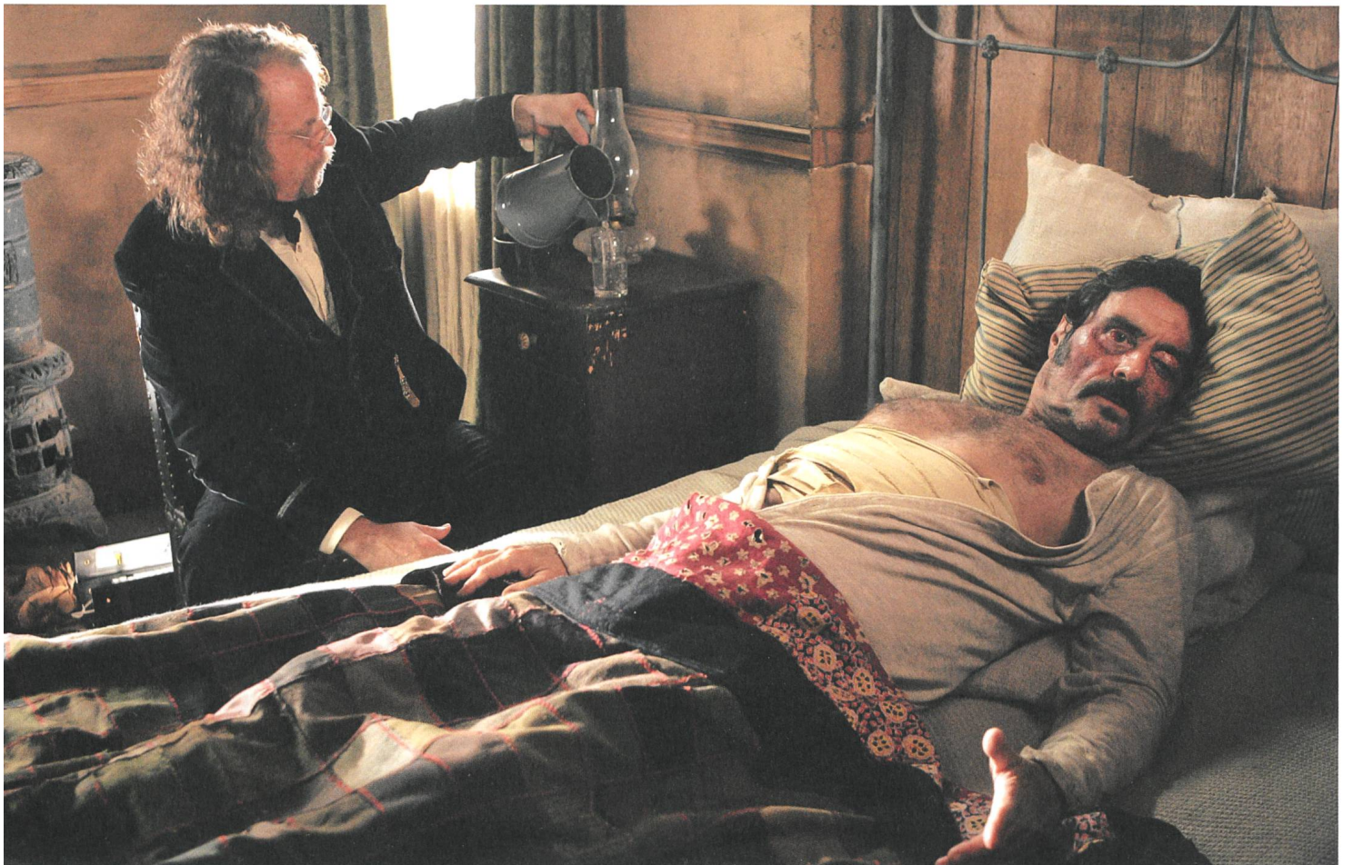
Deadwood mit Ian McShane, Brad Dourif