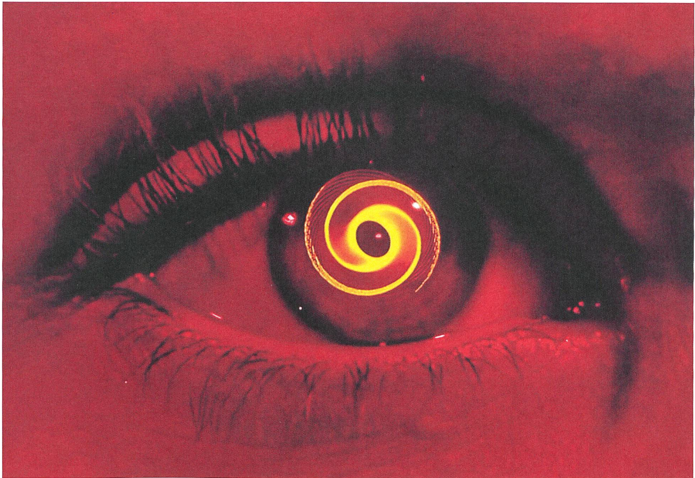
Vorspann zu Vertigo (1958) Design: Saul Bass

Verlag Filmbulletin Dienersstrasse 16 CH-8004 Zürich +41 52 226 05 55 info@filmbulletin.ch www.filmbulletin.ch