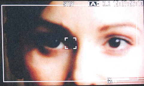
Das Hotelzimmer (2014) Kamera: Michael Hammon