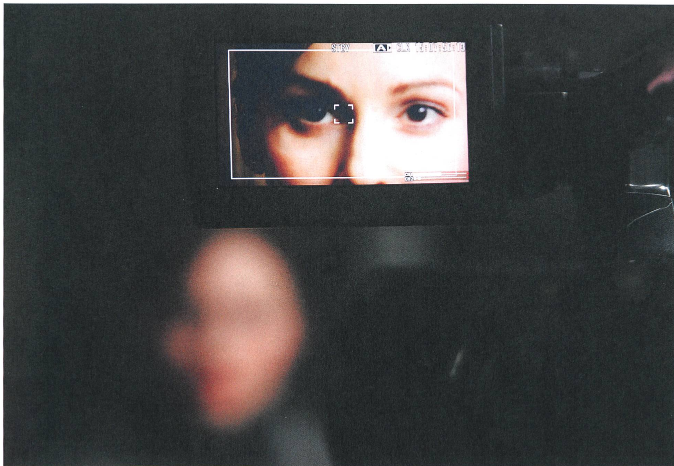
Das Hotelzimmer (2014) Kamera: Michael Hammon