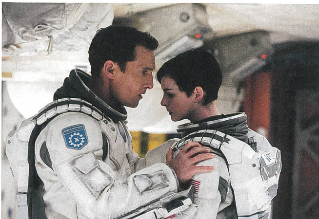
Interstellar (2014) Regie: Christopher Nolan