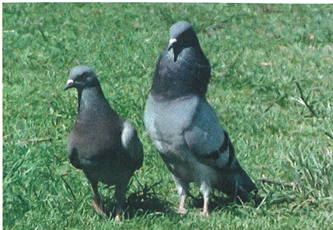
Les pigeons du square (1982) Regie: Jean Painlevé