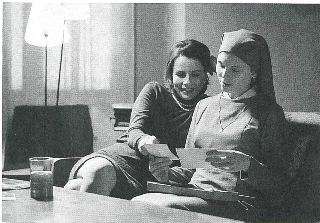
Ida (2013) Regie: Pawel Pawlikowski