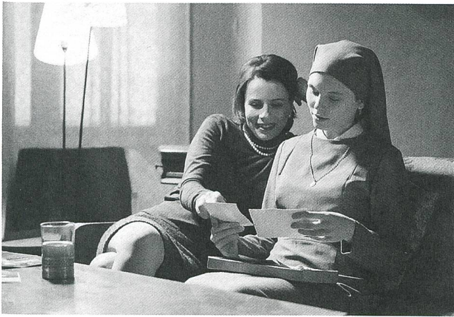
Ida (2013) Regie: Pawel Pawlikowski