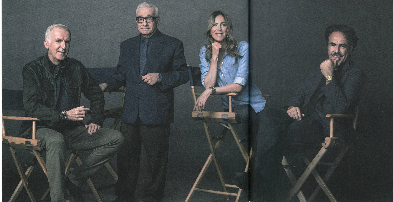
Alejandro G. IÑÁRRITU