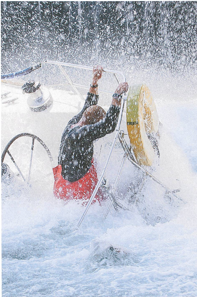
All Is Lost (2013) Regie: J. C. Chandor