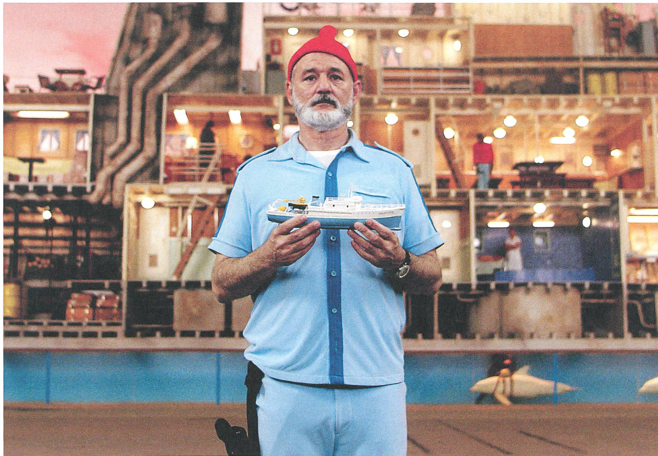
The Life Aquatic with Steve Zissou (2004) Regie: Wes Anderson, mit Bill Murray