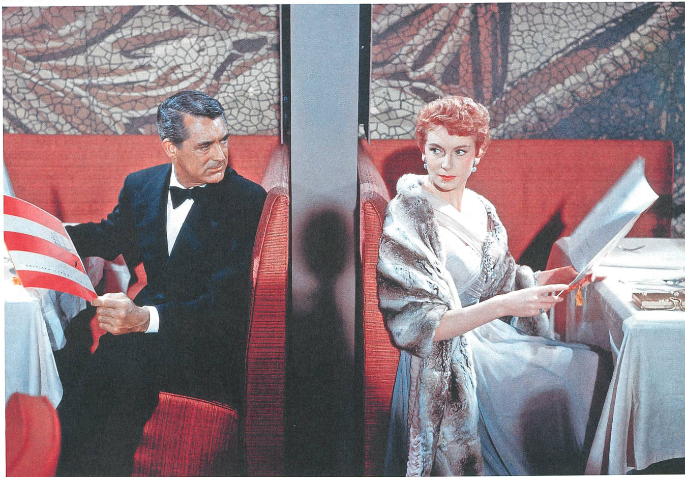
An Affair to Remember Regie: Leo McCarey, mit Cary Grant und Deborah Kerr