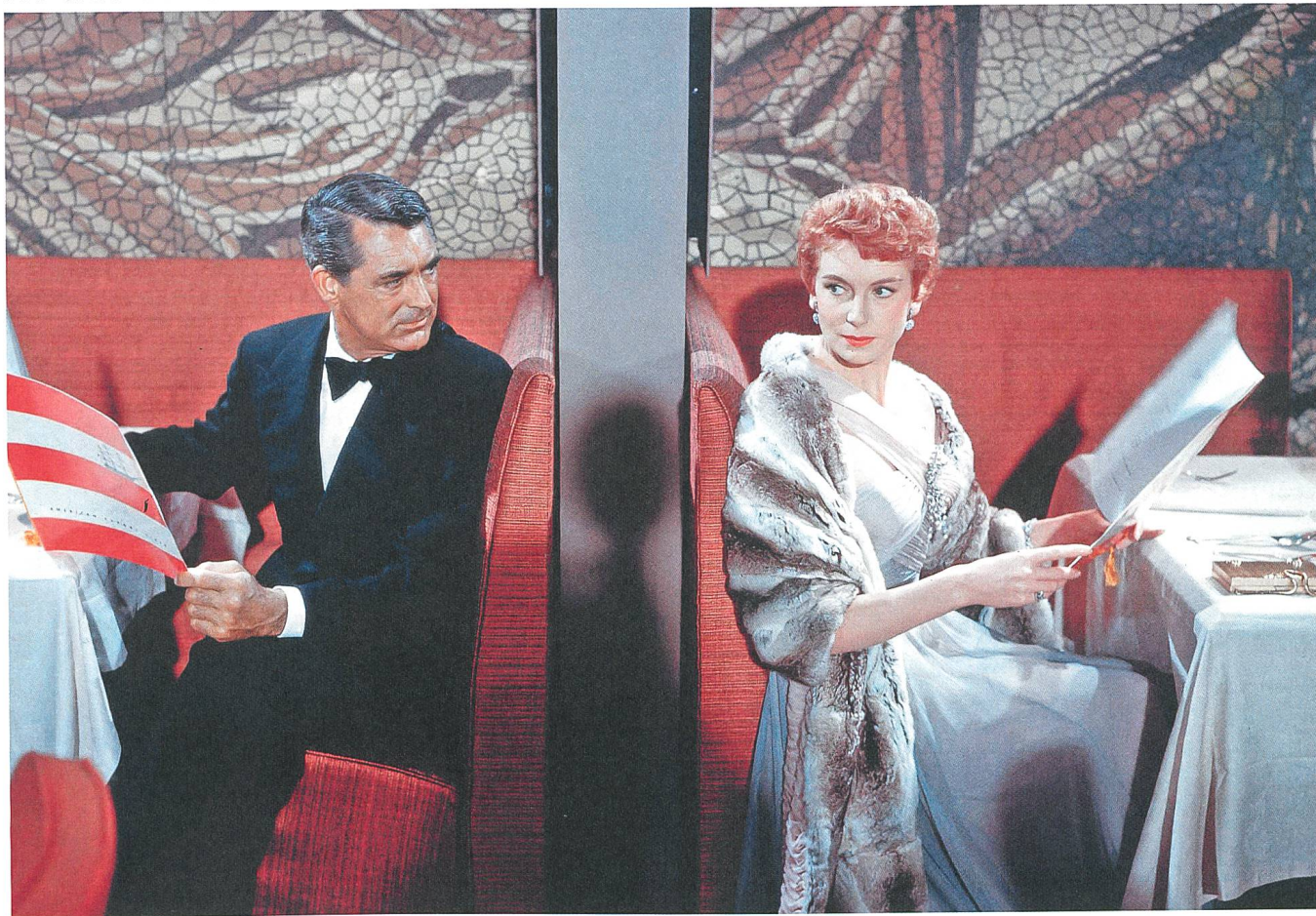
An Affair to Remember. Regie: Leo McCarey, mit Cary Grant und Deborah Kerr