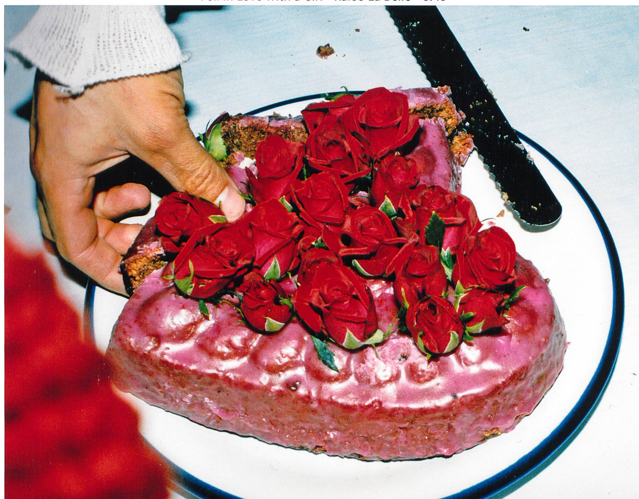
Fell in Love with a Girl Kaleo La Belle S.16