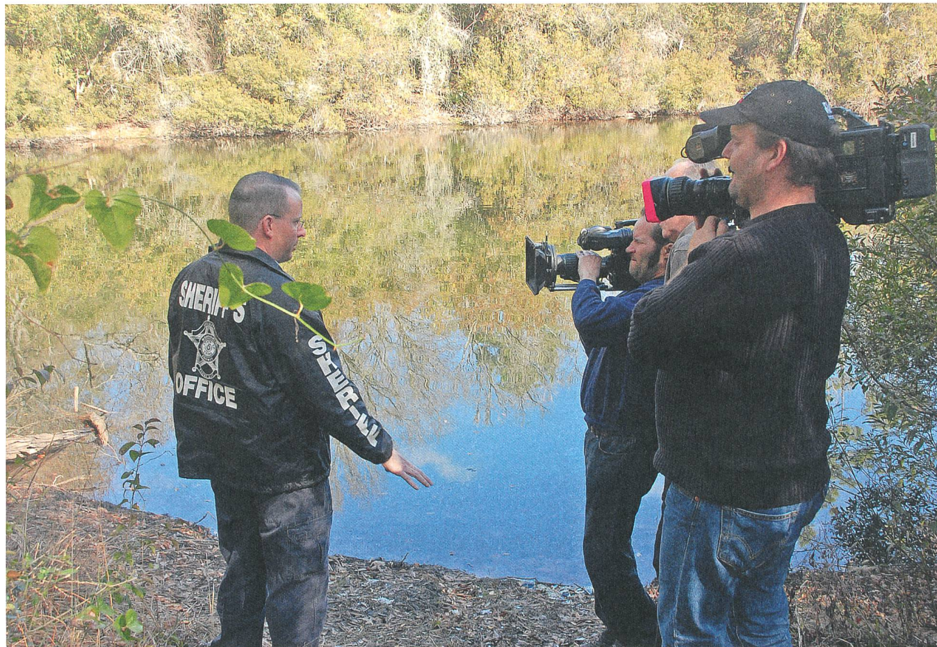
Bei den Dreharbeiten zu Werner Herzogs Dokumentarfilm Into the Abyss (2011)