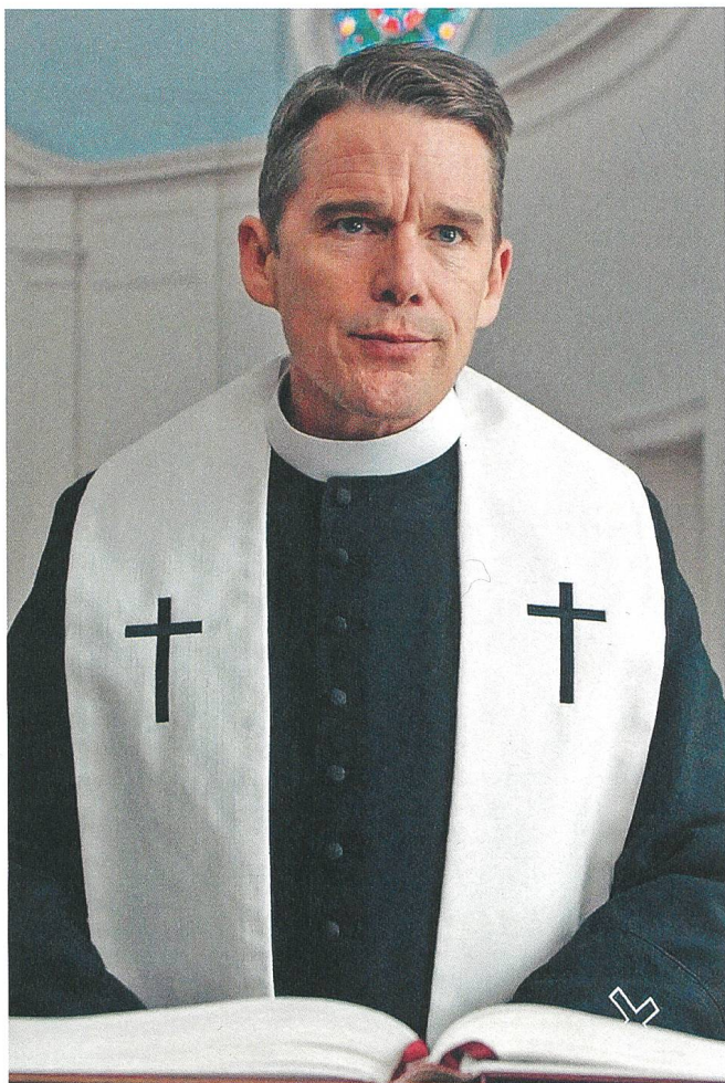
First Reformed (2017) Regie: Paul Schrader, mit Ethan Hawke