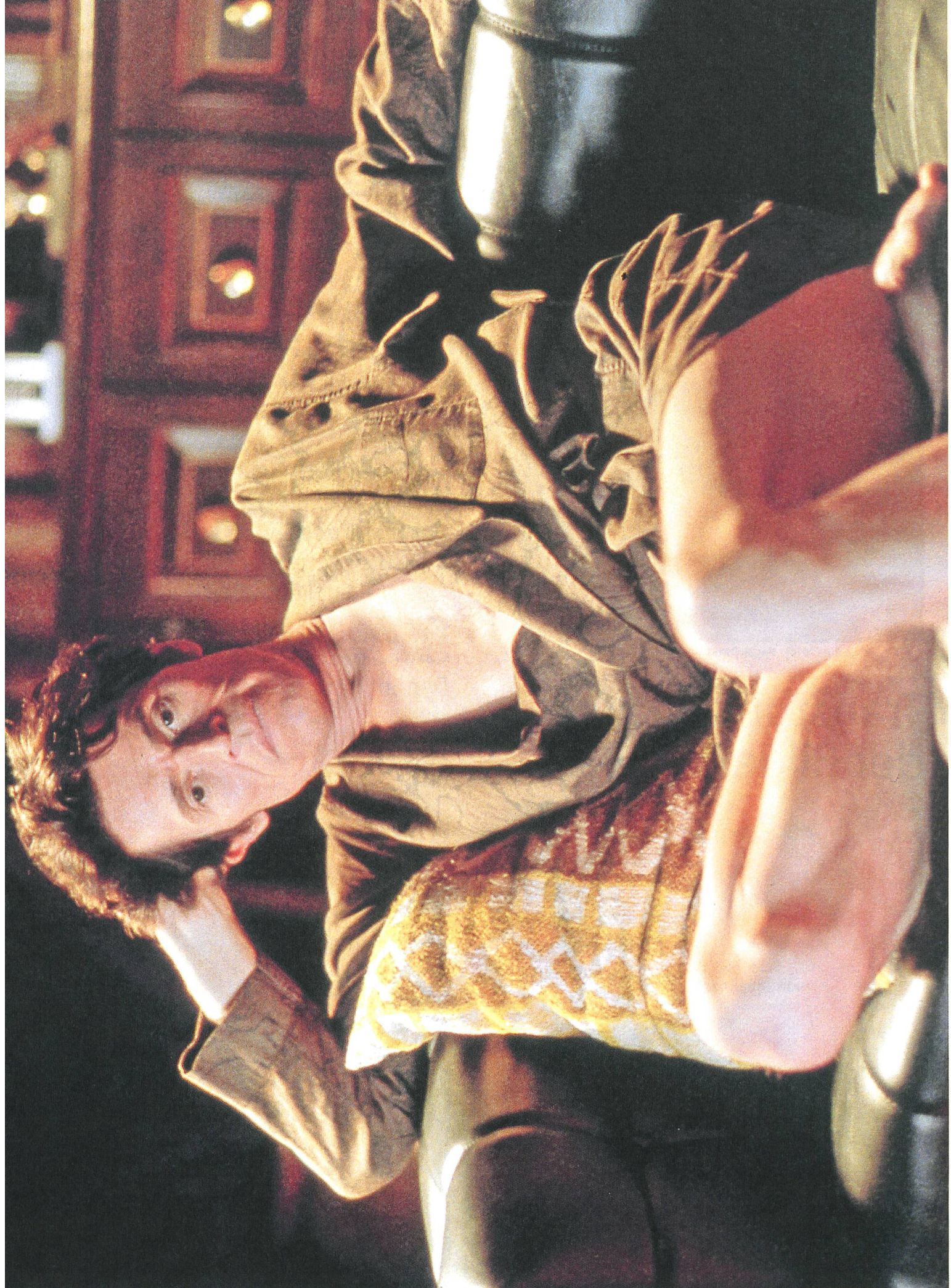
Auto Focus (2002) Regie: Paul Schrader, mit Willem Dafoe