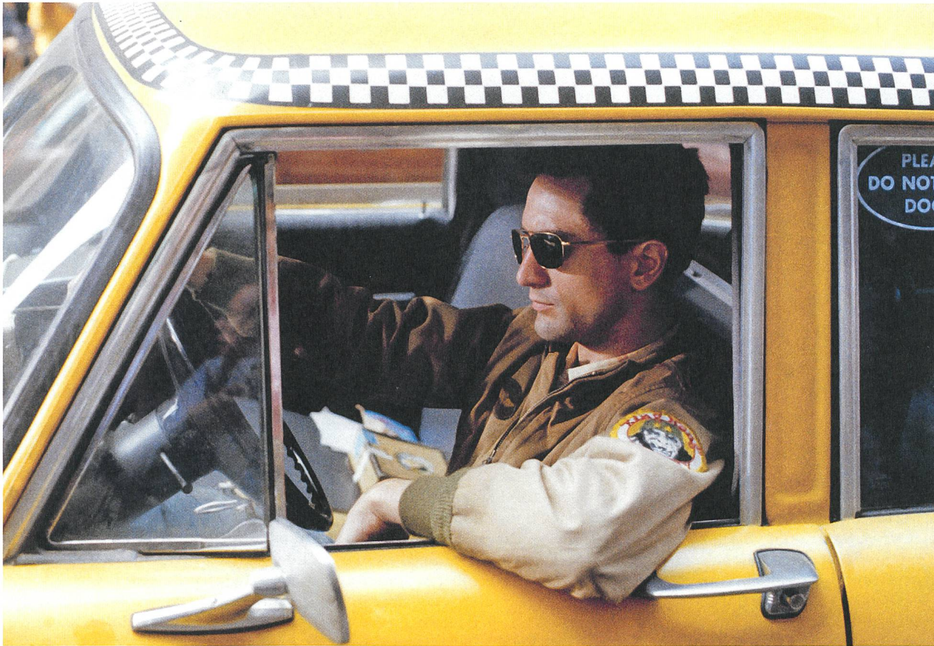
Taxi Driver (1976) Drehbuch: Paul Schrader, mit Robert de Niro