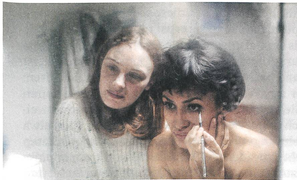
Jeune femme Regie: Léonor Serraille