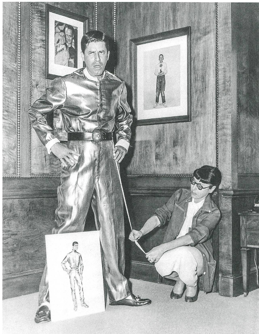
Kostümbildnerin Edith Head nimmt Mass an Jerry Lewis am Set von Visit to a Small Planet (1960)