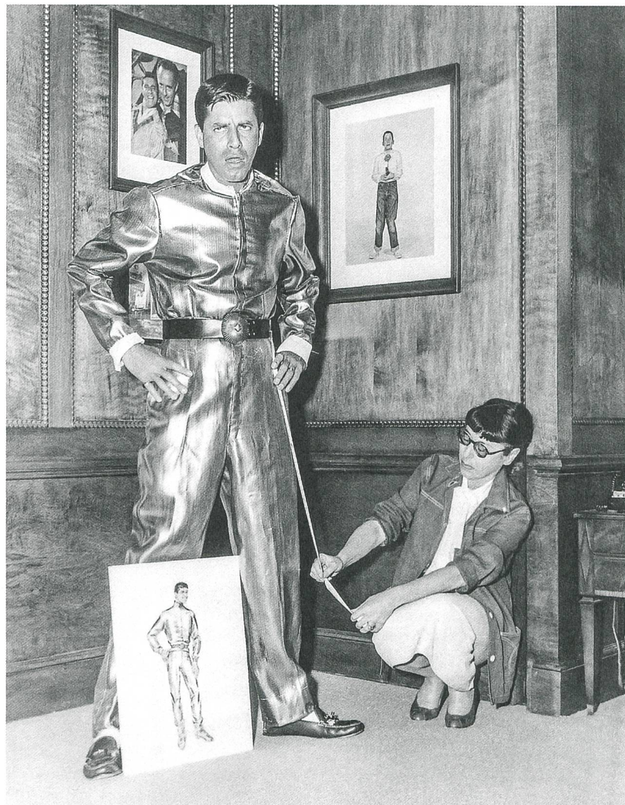
Kostümbildnerin Edith Head nimmt Mass an Jerry Lewis am Set von Visit to a Small Planet (1960)

59. Jahrgang Heft Nummer 368 / Januar 2018 / Nr. 1 ISSN 0257-7852