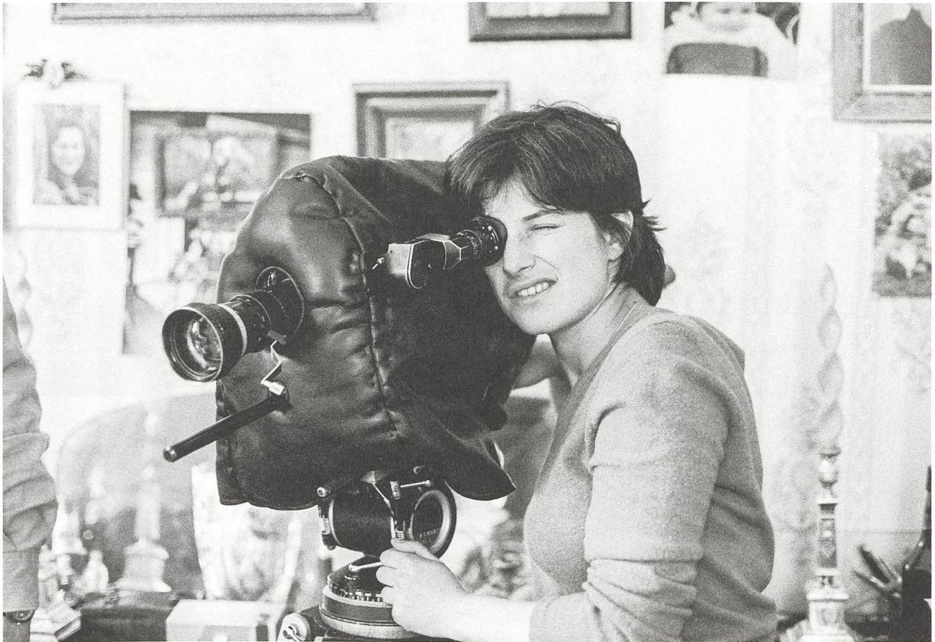
Chantal Akerman bei den Dreharbeiten zu Dis-moi (1980)