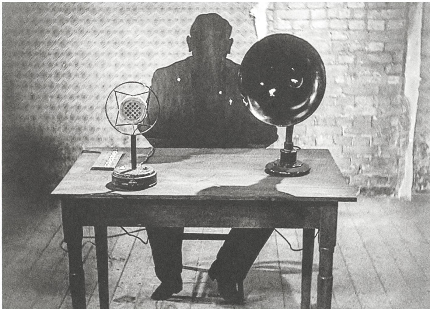
Das Testament des Dr. Mabuse (1933) Regie: Fritz Lang