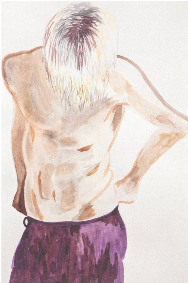
Untitled (2011) Gus Van Sant

© Gus Van Sant, Courtesy de l'artiste et de la Galerie Gagosian