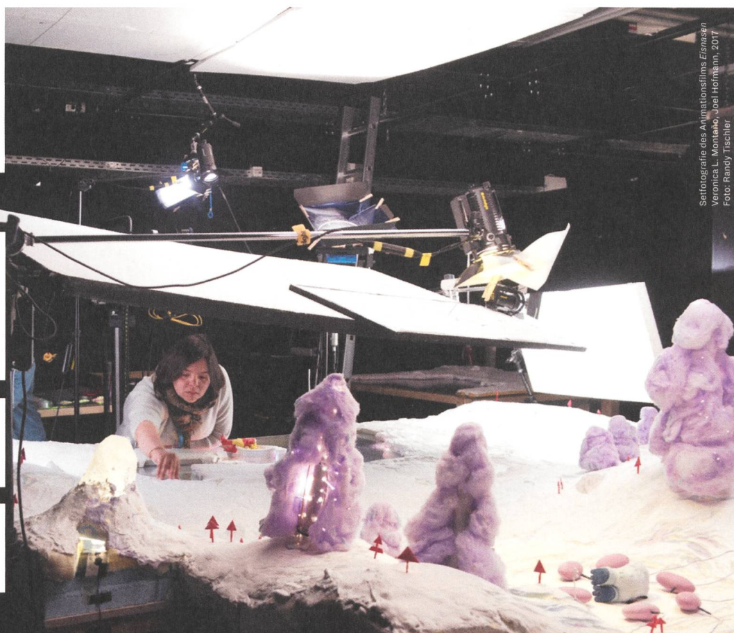
Selbstporträte des Animationsfilms Eisnisen Veronica L. Montano, Joel Hofmann, 2017