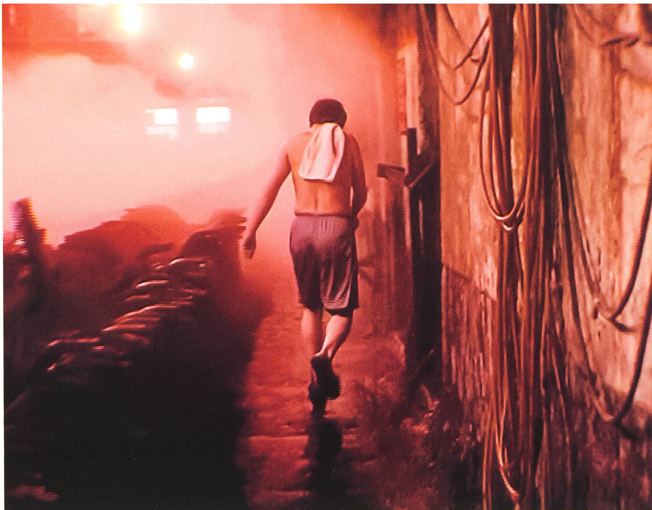
Wang Bing Der Humanist hinter der Kamera S. 50