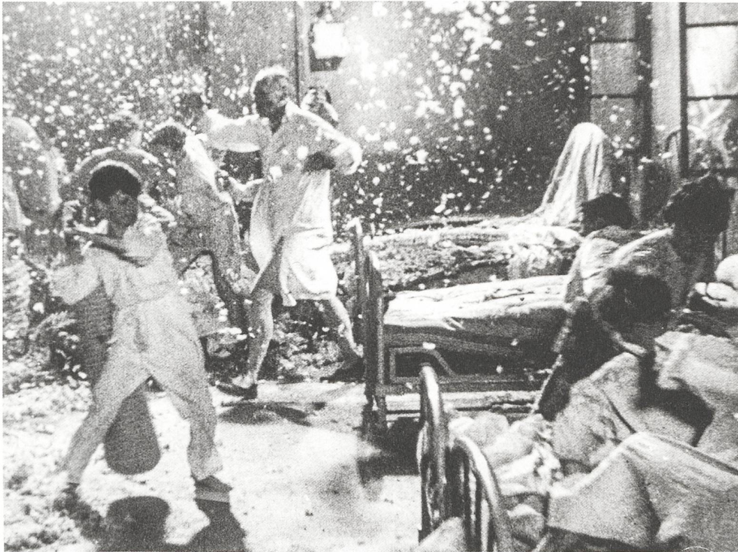
Zéro de conduite (1933) Régie: Jean Vigo

«Monsieur le Professeur, je vous dit merde!»