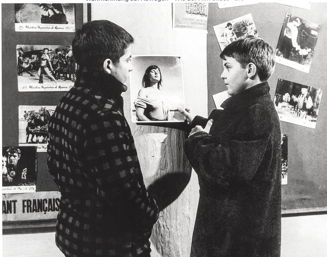
Wahrnehmung auf Abwegen Wie der Film bildet S. 6