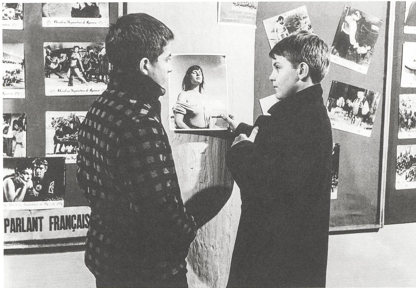
Les 400 coups (1959) Regie: François Truffaut, mit Jean-Pierre L  aud und Patrick Auffay