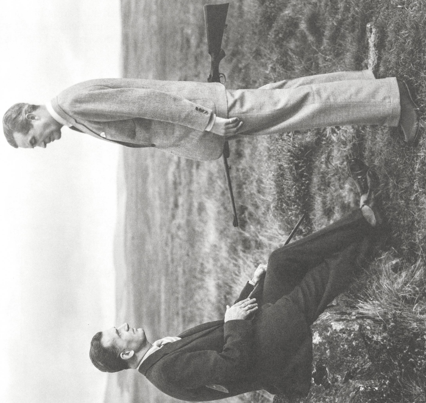
Circle of Danger (1951) Hugh Sinclair und Ray Milland