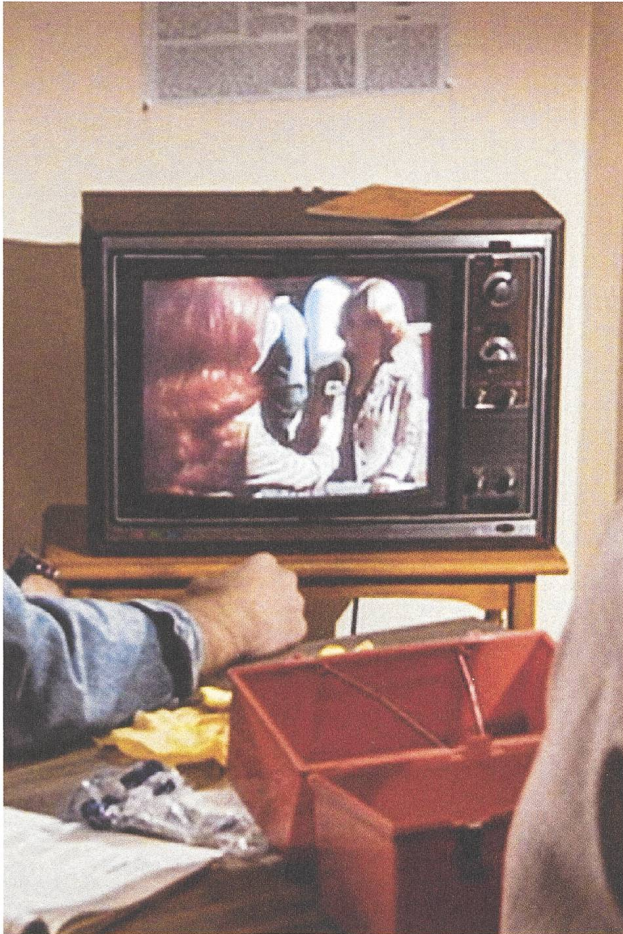
The China Syndrome (1979) Regie: James Bridges