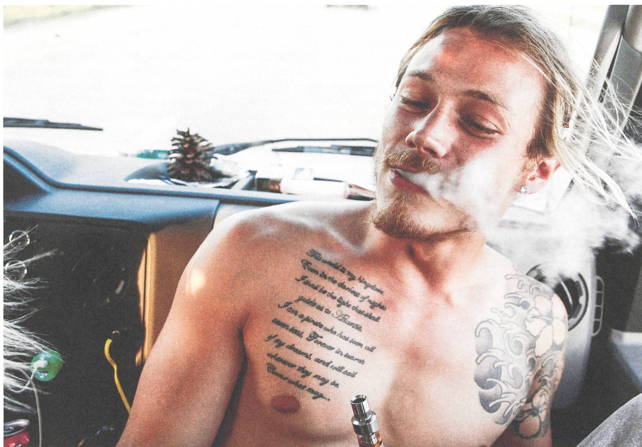
American Honey (2016) Regie: Andrea Arnold

Filmbulletin Diensterstrasse 16, CH-8004 Zürich +41 52 226 05 55 info@filmbulletin.ch www.filmbulletin.ch