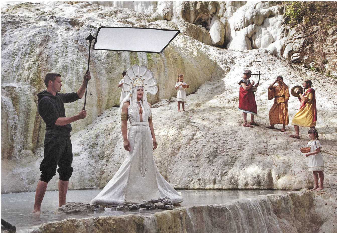
Le meraviglie (2014) Regie: Alice Rohrwacher, Produzentin: Tiziana Soudani