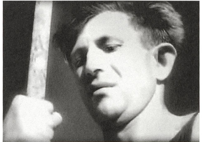
Land of Promise (1935) Regie: Juda Leman