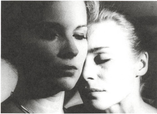
Tystnaden / Das Schweigen (1963) Regie: Ingmar Bergman