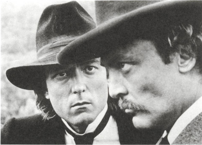
The Long Riders (1980) Regie: Walter Hill