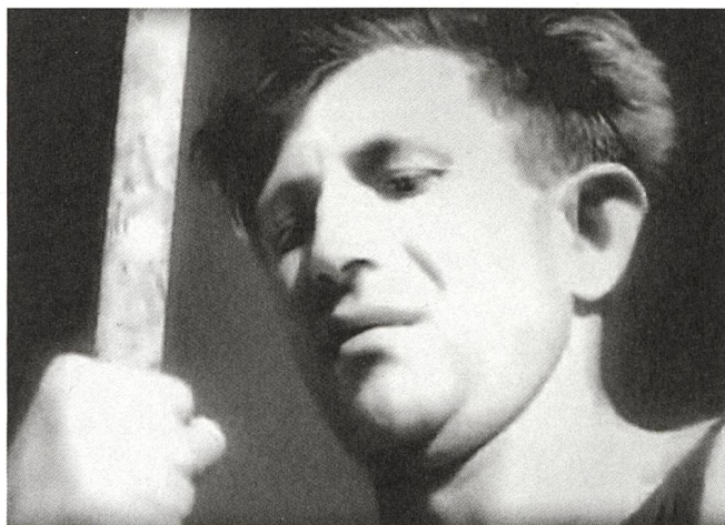
Land of Promise (1935) Regie: Juda Leman