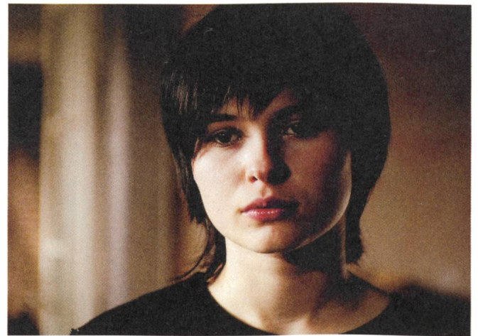
Liebeskind (2005) Regie: Jeanette Wagner