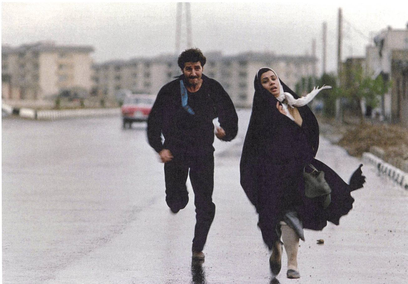
Nargess (1992) Regie: Rakshan Bani-Etemad

Verlag Filmbulletin Diererstrasse 16, CH-8004 Zürich +41 52 226 05 55 info@filmbulletin.ch www.filmbulletin.ch