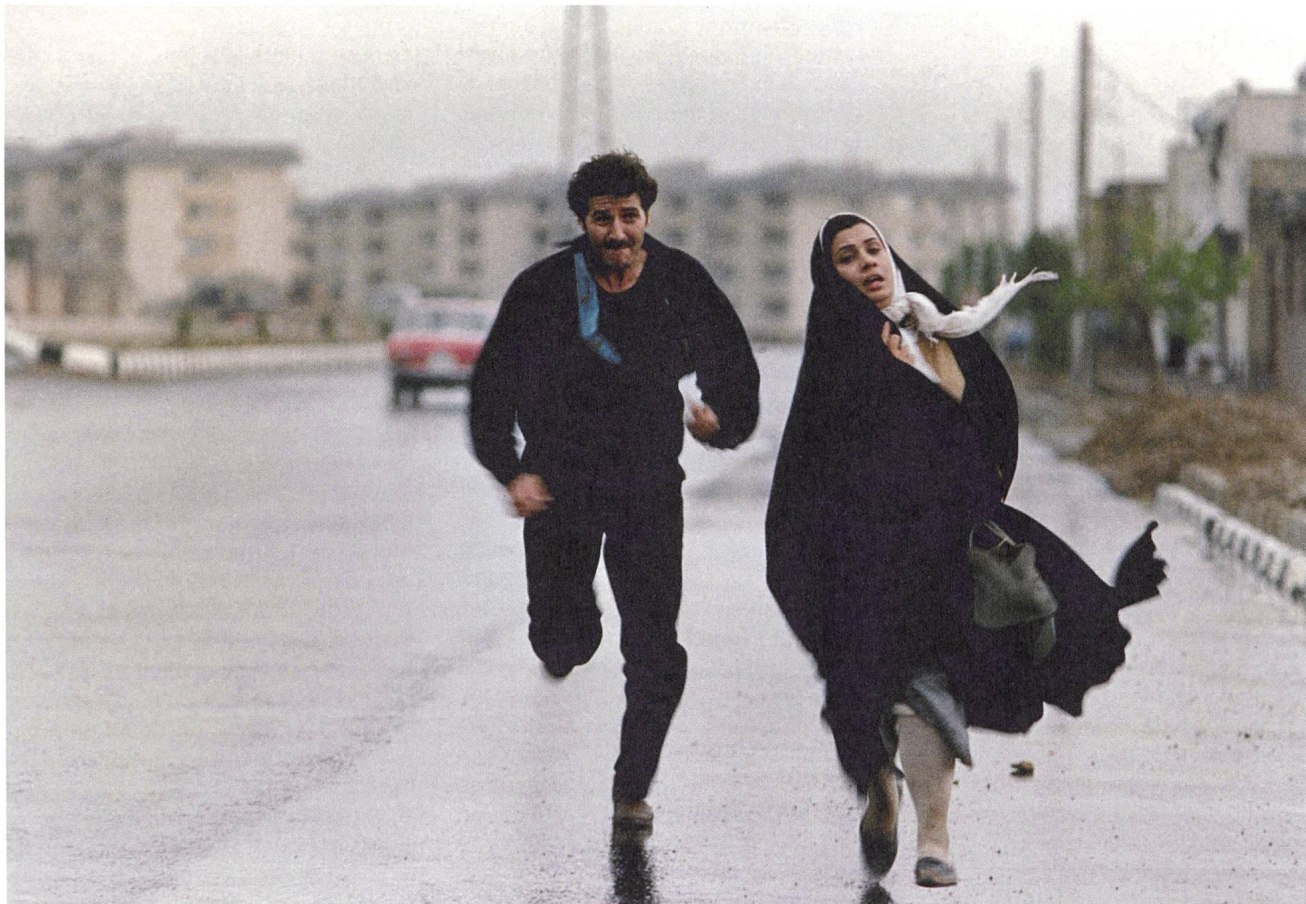
Nargess (1992) Regie: Rakshan Bani-Etemad

Verlag Filmbulletin Diererstrasse 16, CH-8004 Zürich +41 52 226 05 55 info@filmbulletin.ch www.filmbulletin.ch