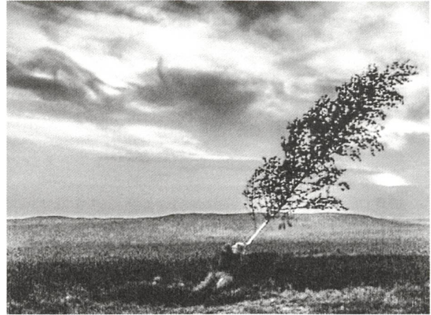
Die Jungfrauenquelle (1960) Regie: Ingmar Bergman

«Die Zuschauer überraschen mit dem, was sie erwarten»