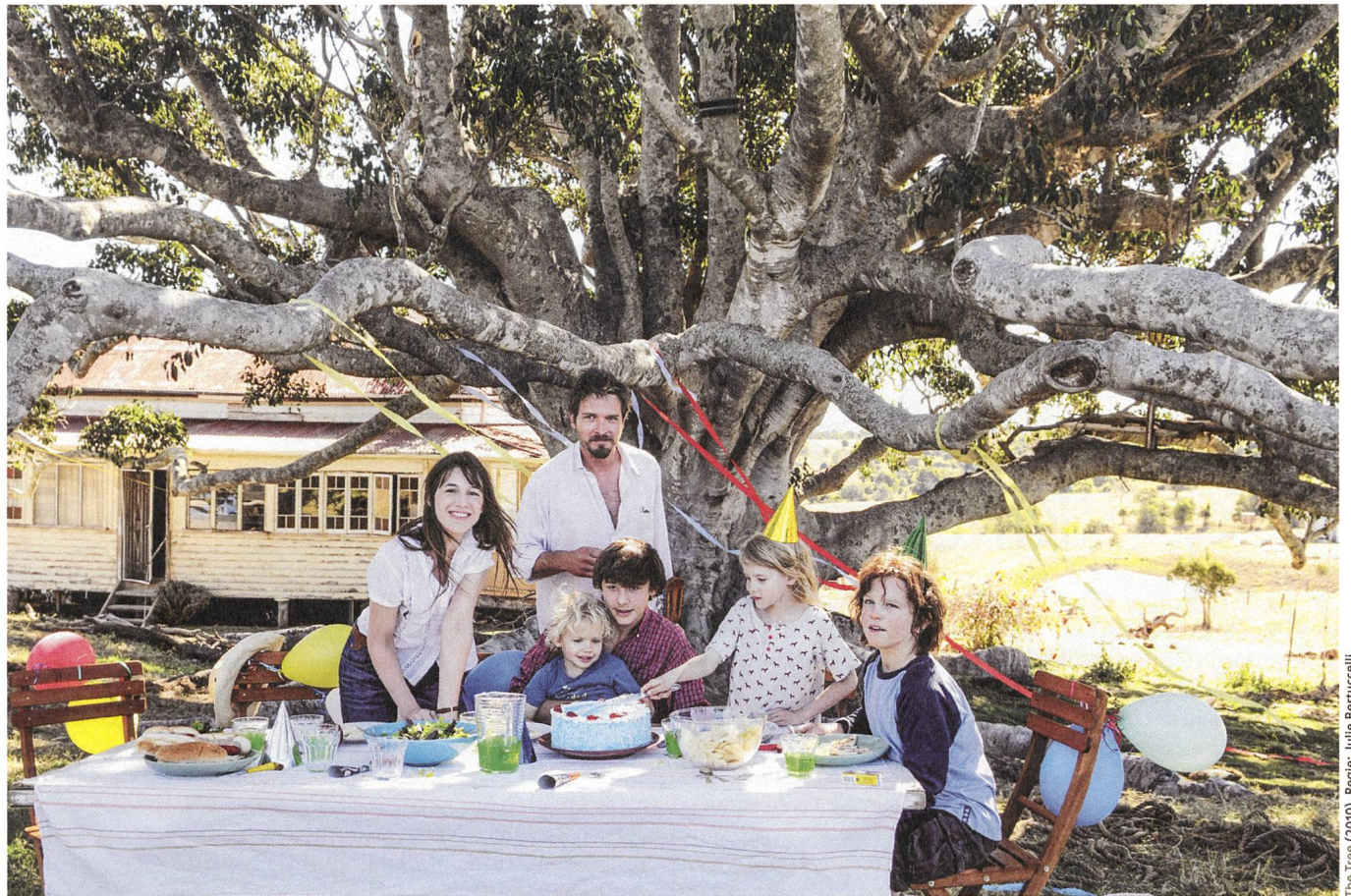
The Tree (2010), Regie: Julie Bertucelli