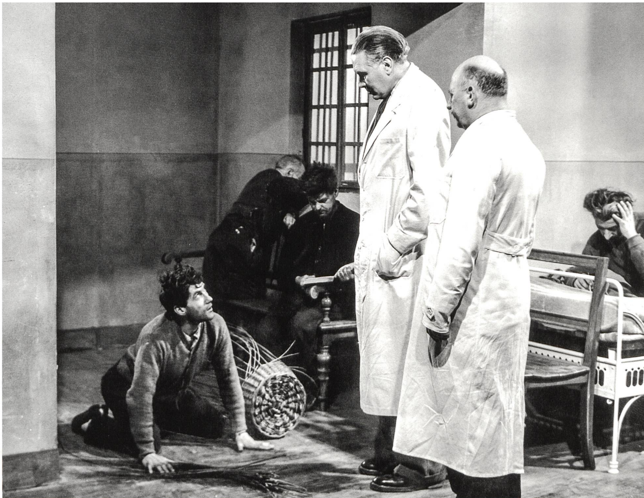
Bilder geben Übertragungen zwischen Film und Psychiatrie S.46