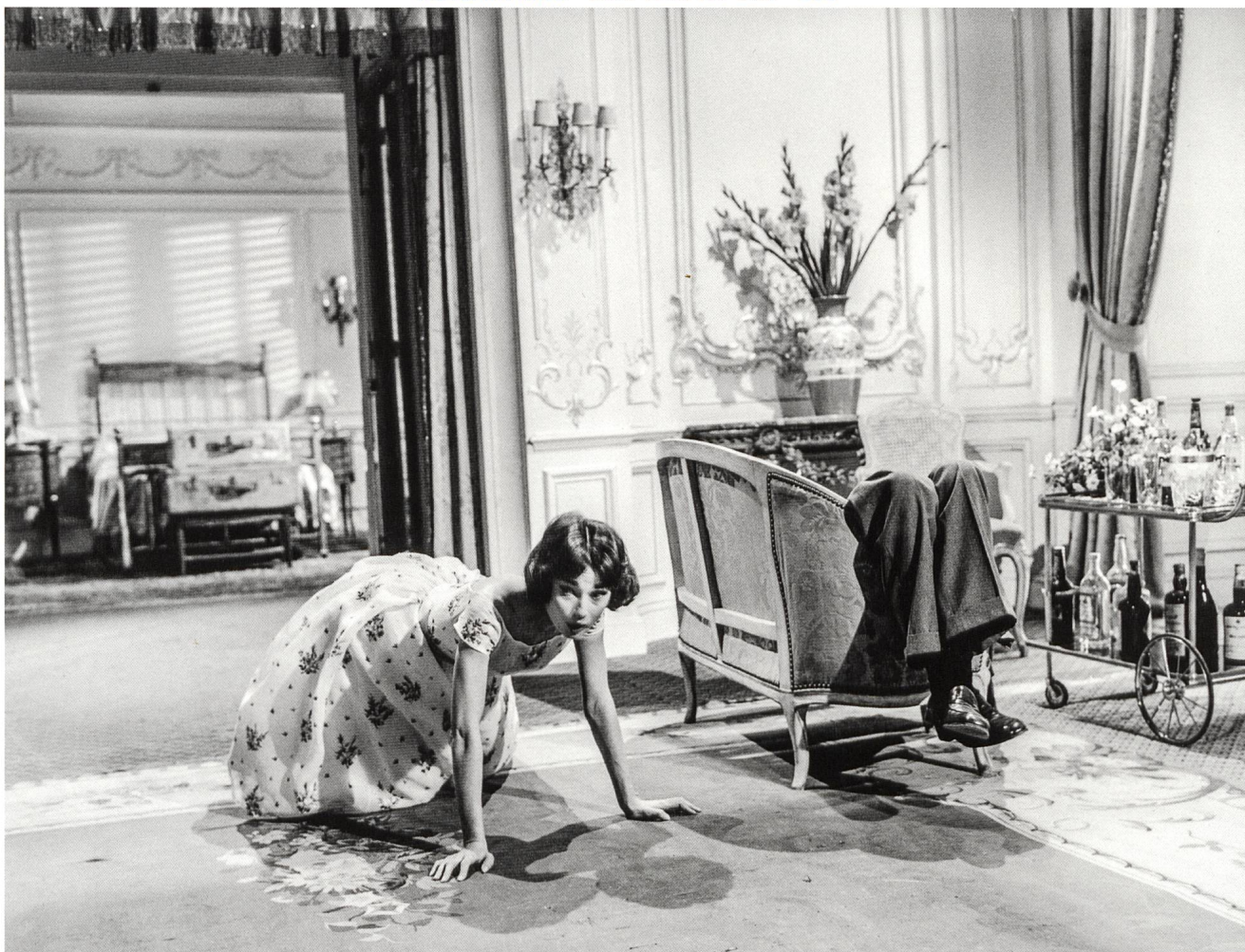
Hotel im Kino Eine Welt für sich S.6