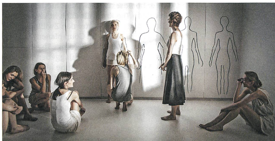
Body Sich selbst begegnen