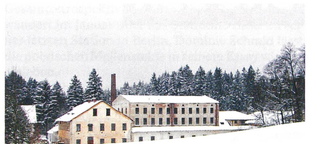
Über die Jahre (2015) von Nikolaus Geyrhalter