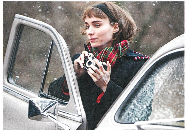
Carol (2015) Rooney Mara