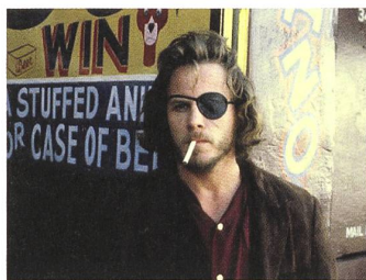
CUTTER'S WAY Regie: Ivan Passer