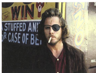
CUTTER'S WAY Regie: Ivan Passer