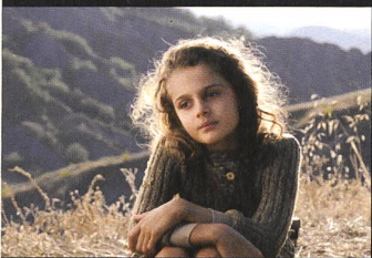
L'UOMO CHE VERRÀ Ein Mensch wird kommen von Giorgio Diritti