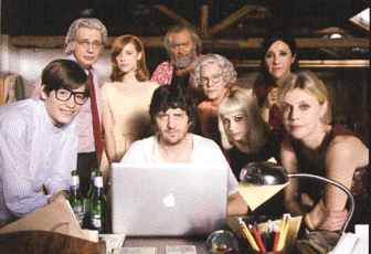
HAPPY FAMILY von Gabriele Salvatores