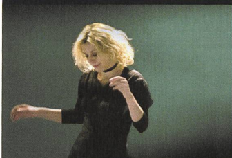
LO SPAZIO BIANCO Der weisse Raum von Francesca Comencini