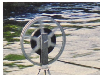
Roman Signer Filmrolle, 1985 Super-8-Filmstill

Für einmal hat das Aargauer Kunsthhaus fast alle der flexiblen Ausstellungswände aus dem Erdgeschoss des Erweiterungsbaus entfernt, um einen grossflächigen Ausstellungssaal von über 600 Quadratmetern zu erhalten. In diesem sind 36 Super-8-Filme von Roman Signer nebeneinander gereiht und erinnern damit an eine museale Bildhängung. In diesem Fall sind es nicht 36 unbewegte Bilder, es sind 36 Filme, alle tonlos, die Roman Signer aus rund zweihundert Filmen ausgewählt hat. Sie sind ohne Ton, weil sie als Dokumentationen seiner Installationen und Aktionen zu verstehen sind und weil dadurch, wie Signer an der Medienkonferenz erklärte, die Konzentration auf das eigentliche Geschehen nicht absorbiert wird.