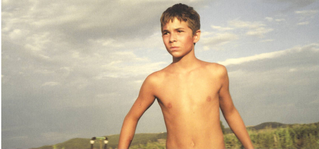
← Giochi d'estate Lungometraggio di Rolando Colla