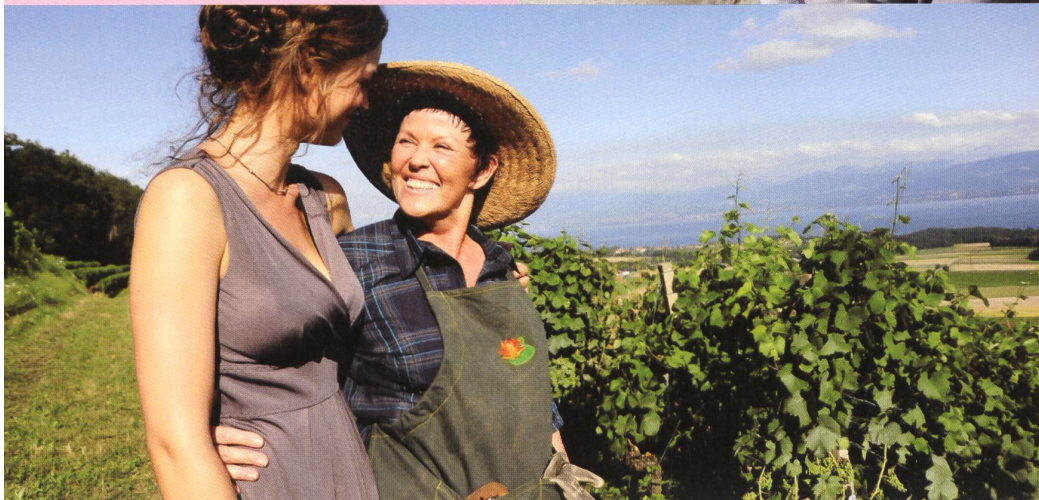
← T'es pas la seule! Série TV de Pierre-Antoine Hiroz