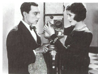
Buster Keaton in THE CAMERAMAN Regie: Buster Keaton