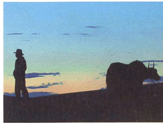
SUMMER PASTURE Regie: Nelson Walker und Lynn True

So haben wir, aus reicher Fülle schöpfend, ein Ensemble von sieben Filmen zusammengestellt. Ähnlich radikal im Ansatz wie BLOOD CALLS YOU ist Jonaas Neuvonens REINDEER SPOTTING , das verblüffend intime Porträt eines drogensüchtigen jungen Mannes aus dem finnischen Rovaniemi. Bass erstaunt waren wir, als wir im Laufe unseres Auswahlwochenendes ein weiteres Mal in Rovaniemi landeten. Dass wir auch den zweiten finnischen Film ins Programm aufnahmen, begründet sich allerdings nicht geographisch, sondern durch die Tatsache, dass Virpi Sautari in AUF WIEDERSEHEN FINNLAND eine weitgehend unbekannte Geschichte erzählt: die der