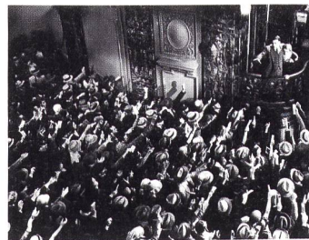
AMERICAN MADNESS Regie: Frank Capra