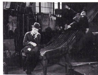
THE BITTER TEA OF GENERAL YEN Regie: Frank Capra

Frank Capra, Regisseur von Evergreens wie MR. DEEDS GOES TO TOWN (1936) und YOU CAN'T TAKE IT WITH YOU, gehört gewiss nicht zu den vergessenen Namen der Filmgeschichte. Als ihm 1934 mit IT HAPPENED ONE NIGHT der – von der Academy mit gleich fünf Oscars markierte – Durchbruch zu allgemeiner Anerkennung gelang, konnte er bereits auf ein Werk von über zwanzig langen, heute aber grösstenteils vergessenen Spielfilmen zurückblicken.