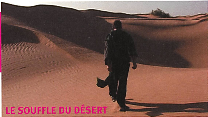
LE SOUFFLE DU DÉSERT