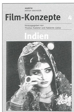
Heft 4 Indien Gastherausgeberin: Susanne Marschall

etwa 100 Seiten ca. € 14,-/sfr 25,30 ISBN 3-88377-836-2